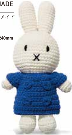
BLUE COAT ブルーコート 8 5328002BC 717953 272256

ミッフィーハンドメイド & ドレス ¥5,000 (+税) ① Size: W130 x D65 x H240mm 素材: コットン100%