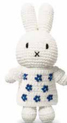
DELFT BLUE デルフトブルー 7 5328002DB 104383 876191