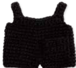
BLACK ブラック 5328018BK 8 719324 381826