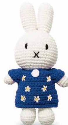
BLUE FLOWER ブルーフラワー 7 5328002BF 101423 093341