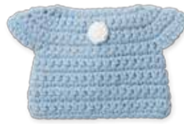
PASTEL BLUE パステルブルー 5328016PB 7 104381 243551