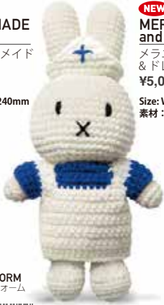
WHITE UNIFORM ホワイトユニフォーム 5328003WU 8 717953 272249

ミッフィーハンドメイド & ドレス ¥5,000 (+税) ① Size: W130 x D65 x H240mm 素材: コットン100%