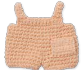
PASTEL PINK パステルピンク 5328018PP 7 104389 734617