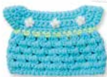
NEW ALMOND BLOSSOM