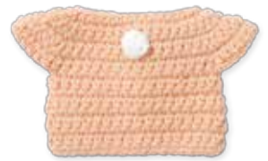
PASTEL PINK パステルピンク 5328016PP 7 104381 884433