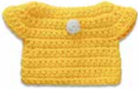
YELLOW イエロー 5328016YE 8 711932 700075