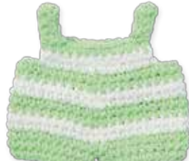
PASTEL STRIPED パステルストライプ 5328018PS 7 104385 684312