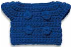
BLUE ブルー 5328017BL 8 717953 272225