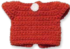
RED レッド 5328016RE 8 717953 272287