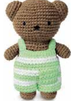
GREEN STRIPE グリーンストライプ 8 5328005GS 719324 381505

ボリスハンドメイド & オーバーオール ¥5,000 (+税) ① Size: W130 x D65 x H190mm