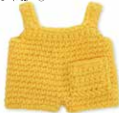
YELLOW イエロー 5328018YE 7 101429 088280