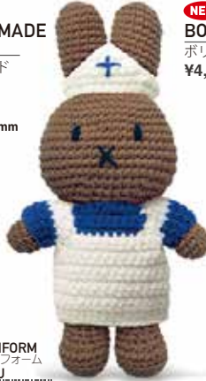
WHITE UNIFORM ホワイトユニフォーム 5328004WU 8 719327 002452

メラニーハンドメイド & ドレス ¥5,000 (+税) ① Size: W130 x D65 x H240mm 素材: コットン100%