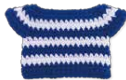
BLUE ブルー 5328019BL 7 101424 755897