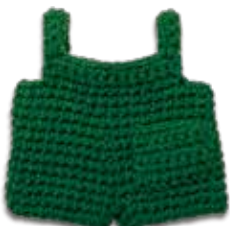
GREEN グリーン 5328018GR 8 719327 000090