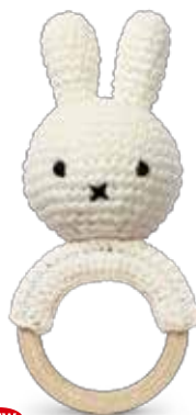
NEW MIFFY TEETHER WITH MUSIC ミッフィーティザーwミュージック ¥3,900 (+税) ② Size: W85 x D55 x H180mm 素材: コットン100%

BLACK STRIPE ブラックストライプ 5328012BK 8 719324 381598