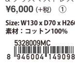
8 5328009MC 946004 149098

NEW MIFFY HANDMADE and CHRISTMAS DRESS ミッフィーハンドメイド & クリスマスドレス ¥6,000 (+税) ① Size: W130 x D70 x H260mm 素材: コットン100%