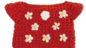
RED レッド 5328020RE 7 101426 272194

Illustrations Dick Bruna © copyright Mercis bv. 1953-2019 www.miffy.com