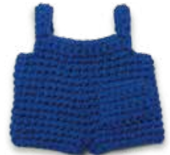
BLUE ブルー 5328018BL 8 719327 000014