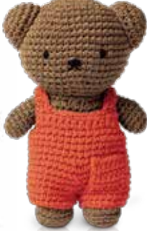
RED レッド 8 5328005RE 719324 381406

ボリスハンドメイド & オーバーオール ¥4,500 (+税) ① Size: W130 x D65 x H190mm 素材: コットン100%