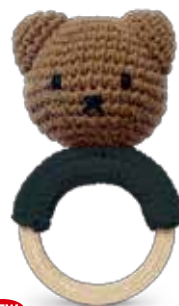
NEW BORIS TEETHER WITH MUSIC ボリスティザーwミュージック ¥3,900 (+税) ② Size: W90 x D55 x H140mm 素材: コットン100%