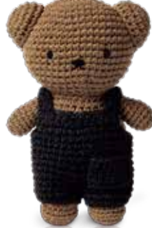
BLACK ブラック 8 5328005BK 719324 381910