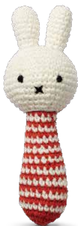
NEW MIFFY RATTLE WITH MUSIC ミッフィーラトルwミュージック ¥3,900 (+税) ② Size: W75 x D55 x H220mm 素材: コットン100%

Illustrations Dick Bruna © copyright Mercis by 1953-2019 www.miffy.com