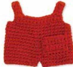
RED レッド 5328018RE 7 101423 351090