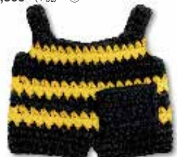
STRIPED BEE ストライプビー 5328018SB 7 104385 437376