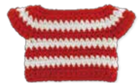
RED レッド 5328019RE 7 101422 642519