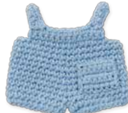
PASTEL BLUE パステルブルー 5328018PB 7 104383 302072