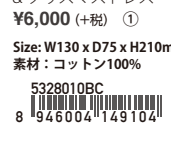
8 5328010BC 946004 149104

NEW BORIS HANDMADE and CHRISTMAS DRESS ミッフィーハンドメイド & クリスマスドレス ¥6,000 (+税) ① Size: W130 x D75 x H210mm 素材: コットン100%