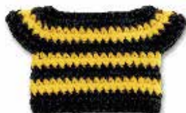
STRIPED BEE ストライプビー 5328019SB 7 104382 151022