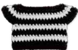
BLACK ブラック 5328019BK 8 719324 381819