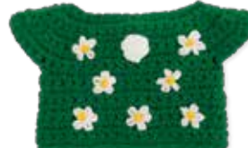
GREEN グリーン 5328020GR 7 101423 146726