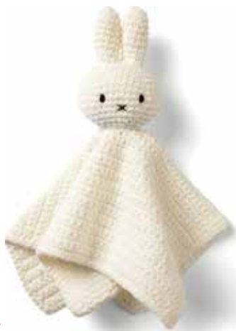
NEW MIFFY WIPE ミッフィーワイプ ¥5,800 (+税) ② Size: W70 x D55 x H270mm WIPE: 270x260mm 素材: コットン100%