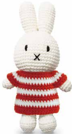
RED STRIPE レッドストライプ 7 5328002RS 101422 905782