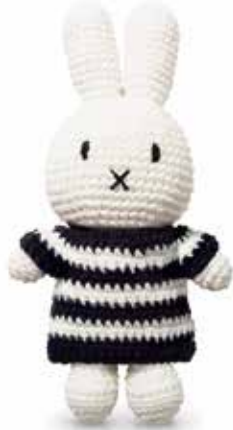
BLACK STRIPE ブラックストライプ 8 5328002BS 719324 381345